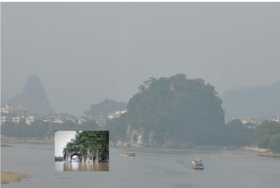
Norsunkärsävuori, Guilin, Guangxi, Kiina

Guilin on erittäin suosittu turistikohde ja lähtösatama Li- jokiristeilyille. Alueen dramaattiset vuorimuodot ja verkkaisesti virtaava, polveileva joki ovat houkuttelleet turisteja jo parin tuhannen vuoden ajan. Kaupunki jäi minulle varsin vieraaksi läpikulkupaikkana kiertomatkillani, mutta ehdin kuitenkin ostaa osmanthus- teetä kaupungista. Guilin sai nimensä Kiinan oliiviksi kutsutun puun mukaan; nimi merkitsee osmanthus metsää. Kuten olettaa saattaa, kaupungin kadut ja jokivarsi ovat reunustettu kukkivilla, huumaavasti tuoksuvilla osmanthus- puilla!