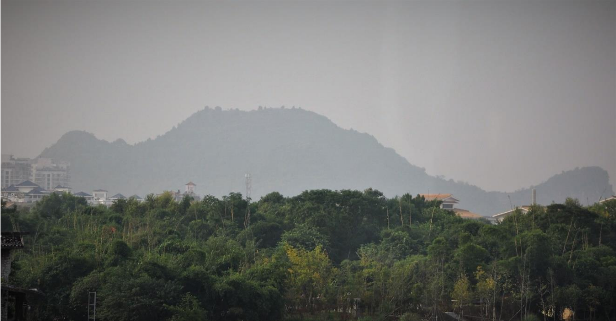
Kynätelinevuori, Guilin, Guangxi, Kiina

Guilin on erittäin suosittu turistikohde ja lähtösatama Li- jokiristeilyille. Alueen dramaattiset vuorimuodot ja verkkaisesti virtaava, polveileva joki ovat houkuttelleet turisteja jo parin tuhannen vuoden ajan. Kaupunki jäi minulle varsin vieraaksi läpikulkupaikkana kiertomatkillani, mutta ehdin kuitenkin ostaa osmanthus- teetä kaupungista. Guilin sai nimensä Kiinan oliiviksi kutsutun puun mukaan; nimi merkitsee osmanthus metsää. Kuten olettaa saattaa, kaupungin kadut ja jokivarsi ovat reunustettu kukkivilla, huumaavasti tuoksuvilla osmanthus- puilla!