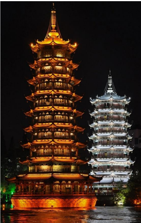
Guilinin Aurinko- ja Kuu- pagodat

vuorimuotojen lisäksi. Guilinissä yhtyvät kaikki; nykyisen kaupungin yksi merkittävimpiä nähtävyyksiä ovat kaksoispagodat Aurinko ja Kuu. Kaupungin sydämeen on muodostunut kaksi pientä järveä, Seetrijärvi ja Banjanjärvi, jotka ovat osa kaupungin romahtanutta vanhaa kanava- ja vallihautaverkosta. Aurinko- ja Kuu- pagodat ovat uudet tosin, mutta kaksoispagodan paikalla seisoivat jo Tang- kaudella (618- 907 jaa) kaksi pagodaa. Pagoda on mielletty tornimaisen ja kalligrafi- sivellintä muistuttuvan muotonsa tähden oppineiden symboliksi. Akateemisena tähtenä tunnettu Wen Qu liitetään fengshuissa tähden #4, joka yhdessä veden kanssa muodostavat paitsi nk. persikankukka- yhdistelmän, myös akateemisen yhdistelmän, joka liitetään luoviin taiteisiin. Varhaisemmat Tang- kauden pagodat ovat seisseet kanavan ja Li- joen välissä, muodostaen kauniin kokonaisuuden kaupungin keskustassa. Nykyiset pagodat ovat rakennettu 2001 ja ovat varsin ainutlaatuiset; Aurinko- pagoda on päällystetty pronssilaatoilla ja Kuu- pagoda valkolasitteisilla laatoilla. Mielenkiintoisesti kaupungin kaikista yliopistoista ainoastaan taideakatemia on sijoittunut liki Seetrijärven kaksoispagodaa.