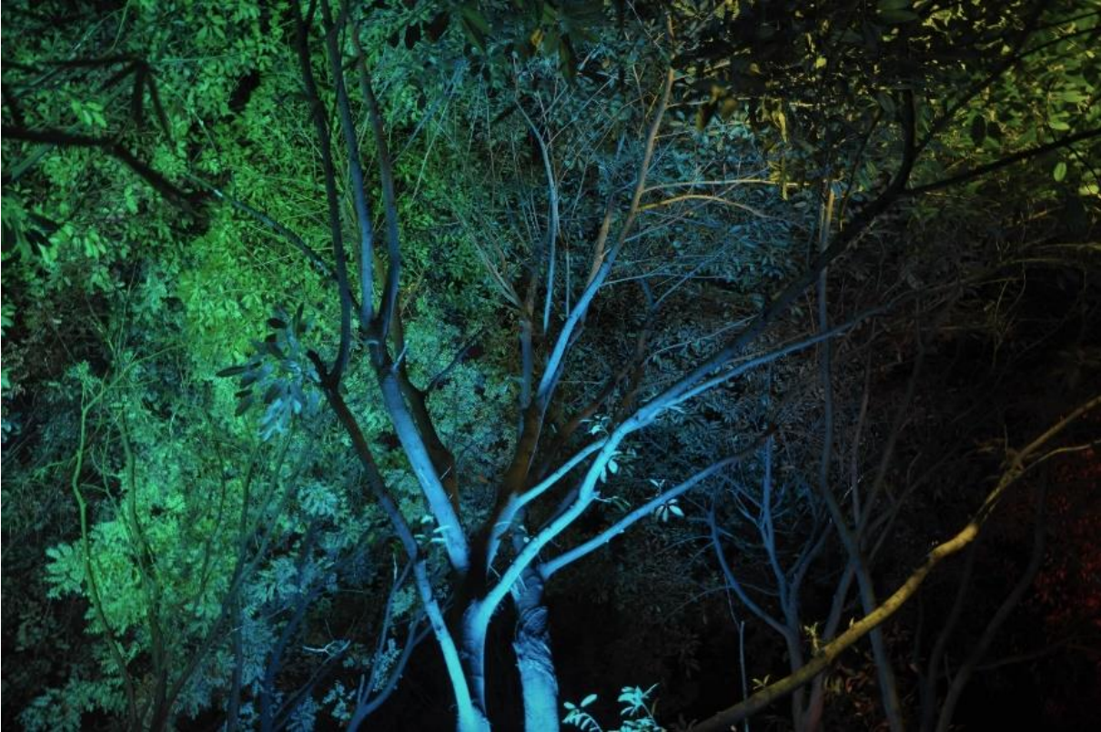
Osmanthus-puu Seetri-järven rannalla, Guilin, Guangxi, Kiina