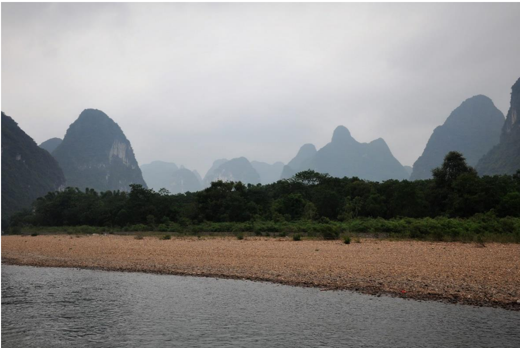
Li-joki Guilinin karstialueella, Guangxi, Kiina

Fengshui- kiertomatkeni aikana minulla oli mahdollisuus tutustua ”Helmi-vesilohikäärmeeseen”. Matkeni alkoi Helmijoen (Zhujiang) delta- alueelta Guangzhousta (entinen Kanton), jatkuen kohti luodetta Guiliniin, kaupunkiin, jonka halki virtaa Helmijoen yksi monista sivujoista, Li- joki (Lijiang). Li- joen alkulähde on Mao’er vuoristossa (Kissavuoristo) n 80km pohjoiseen Guilinistä.